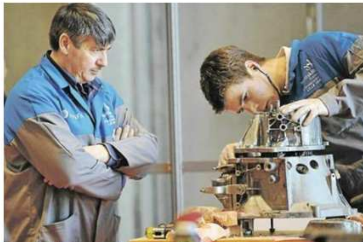
Plus de 16.000 entreprises ont été aidées par le réseau Initiative France

Premier réseau associatif de financement et d'appui à la création d'entreprise, Initiative France a injecté 1,2 milliard d'euros dans l'économie en 2013. Ce qui a permis de créer ou maintenir 6,5 % d'emplois en plus en 2013.